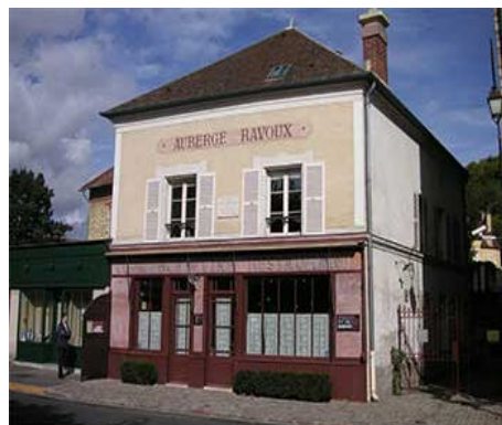
l'auberge Ravoux dite Maison de Van Gogh