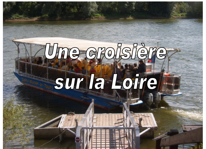
Une croisière sur la Loire