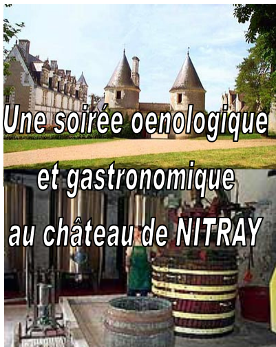
Une soirée oenologique et gastronomique au château de NITRAY