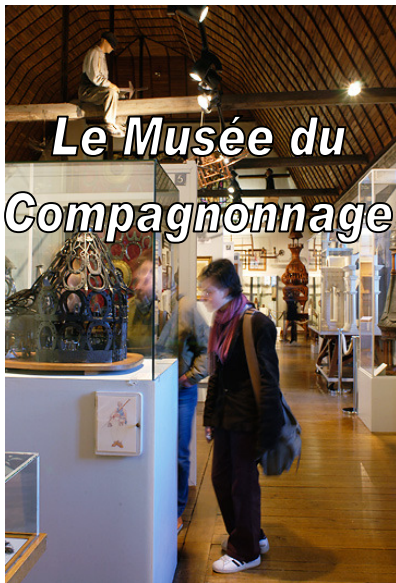
Le Musée du Compagnonnage