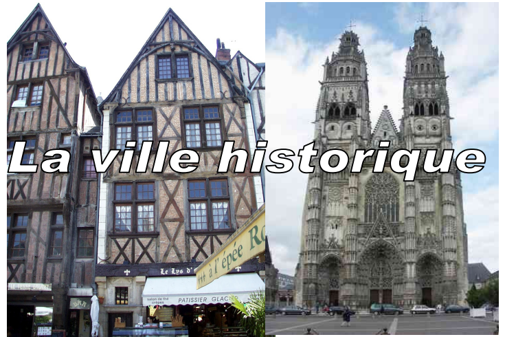
La ville historique